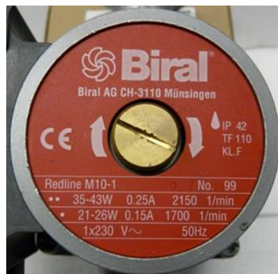
Abbildung 2: Typenschild Pumpe

Falls anstatt einer Leistungsangabe ein Leistungsbereich (z.B. 35 Watt - 43 Watt) angegeben ist, so darf der höhere Leistungswert verwendet werden.