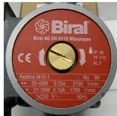
Abbildung 2: Typenschild Pumpe

Falls anstatt einer Leistungsangabe ein Leistungsbereich (z.B. 35 Watt - 43 Watt) angegeben ist, so darf der höhere Leistungswert verwendet werden.