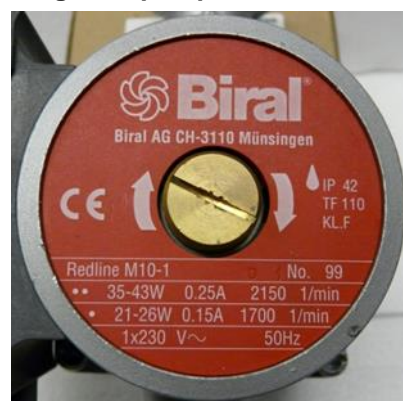
Figura 2: targhetta pompa.

Se invece di una potenza precisa è indicato un range di potenza (ad es. 35-43 watt), deve essere preso il valore più alto.